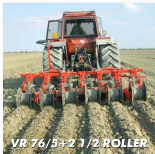
VR 76/5+2 1/2 ROLLER